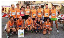
Il gruppo orange in trasferta ad Orbetello

Venerdì 3 Luglio, organizzata dal Gruppo Sportivo Reale Stato dei Presidi, con il patrocinio del Comune di Orbetello, come da tradizione si svolgerà la sesta edizione della "Orbetello Night Run" , gara che si svolge all'interno dei suggestivi vicoli del paese di Orbetello. La gara si svolgerà su di un circuito da percorrere quattro volte per un totale di 6,9 km, tutti nel centro storico del paese che da il nome alla famigerata laguna, importantissima riserva naturale e metà di migliaia di turisti ogni anno. La manifestazione podistica è inoltre inserita nel circuito "Corri nella Maremma 2015".