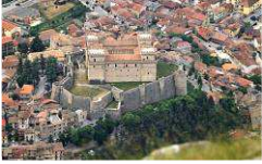
Il Castello Piccolomini di Celano visto durante l'ascesa alla Serra

Quando corro in montagna sono sempre alla ricerca di tracce e testimonianze del passato, oppure di qualche uccello o di animali selvatici o di fiori d'alta quota. E correndo, correndo o ... camminando, quando arrivo in vetta, vi sosto un attimo, come in preghiera. Perché è fantastico stare lassù quando le distanze tra il cielo e la terra si raccorciano, quando la vista si perde negli spazi infiniti e, quando in basso, è tutta roccia, conche, valli e canaloni.