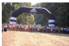
La suggestiva partenza del Trofeo Città di Nettuno

A metà 2008 partecipavo alla mia prima gara ufficiale da podista con la canotta Orange sulla distanza dei diecimila metri. La competizione si svolgeva a Nettuno tra le strade cittadine e terminava nel Piazzale antistante la Basilica ma non prima di aver scollinato sopra Villa Borghese ai confini con Anzio. Era caldo, non caldissimo, e l'estate faceva capolino in maniera ineluttabile. All'altezza del Belvedere, presso la Proloco, mancava circa un chilometro al traguardo e si iniziava a sentire il megafono annunciare gli arrivi. Le difficoltà altimetriche erano finite e rimaneva solo da gestire il lungo e affascinante finale tutto in leggera discesa, se si esclude una leggerissima elevazione prima di Piazza Mazzini, ove presenziava il dio Nettuno solerte ad accogliere e incitare con fare benevolo ma autoritario.