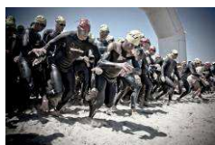
La partenza della frazione Swim dell'Ironman 70.3 di Pescara