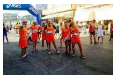
Gli orange pronti a correre ... e a mangiare!!!

Sabato 4 Luglio, dopo il successo delle passate edizioni, ritorna la "Corsalsiccia" , gara podistica organizzata dal Circolo Culturale Nemesis Onlus in collaborazione con Lombardi Sport e la Podistica Pontinia, con il patrocinio del comune di Pontinia.