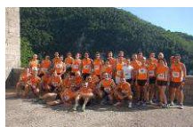
Gli Orange all'edizione 2012

L'associazione sportiva Tivoli Marathon insieme all'associazione locale pro Jenne organizzano la nona edizione della corsa La Jennesina .