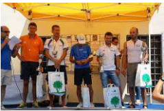
Il nostro Presidente impegnato sul palco delle premiazioni