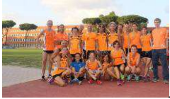
Alcuni dei tanti Orange presenti alla Farnesina

In questi ultimi anni la Podistica Solidarietà, cercando di assecondare le peculiarità dei suoi tesserati ha aperto e intensificato diverse sezioni, quali il trail che ha un suo Criterium, il triathlon che ha intensificato il numero di gare e l'ultima arrivata, del ciclismo, che inizia ad avere un congruo numero di iscritti.