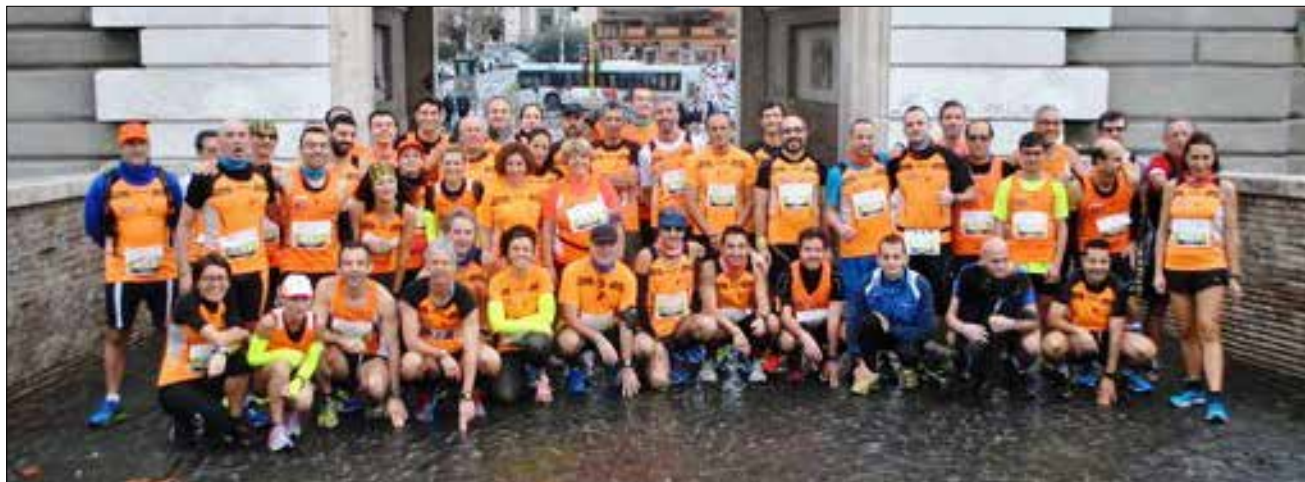
Gli orange a Ponte Milvio!!!