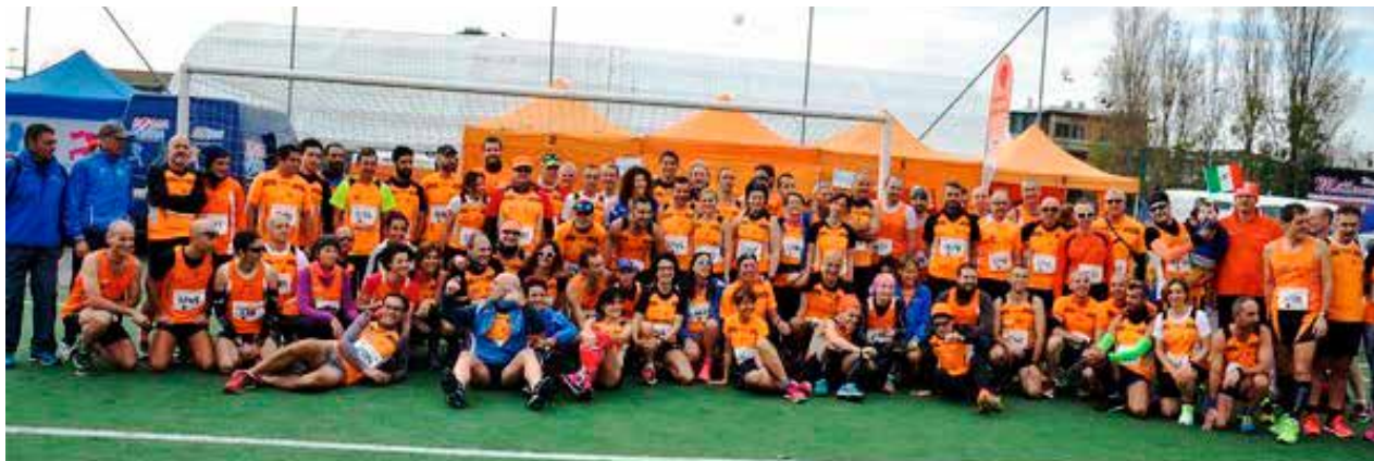
Lo squadrone orange all'interno dello Stadio Cetorelli