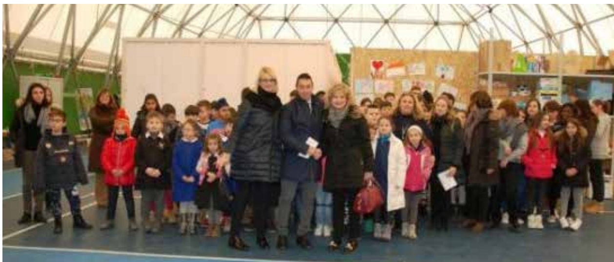
Alcuni dei ragazzi che a breve torneranno a studiare nella nuova scuola di Pieve Torina