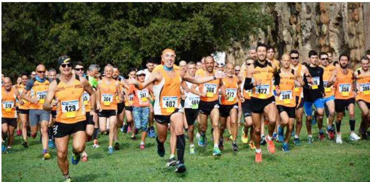
Gli orange alla partenza del Trofeo Podistica Solidarietà

I colori e i sapori dell'autunno iniziano ad avvolgere le nostre giornate e le nostre corse con temperature che fortunatamente non sono ancora molto rigide e ci permettono di correre senza doverci coprire troppo. Il mese di ottobre vede tantissimi successi ed altrettanti piazzamenti sul podio per la nostra società.