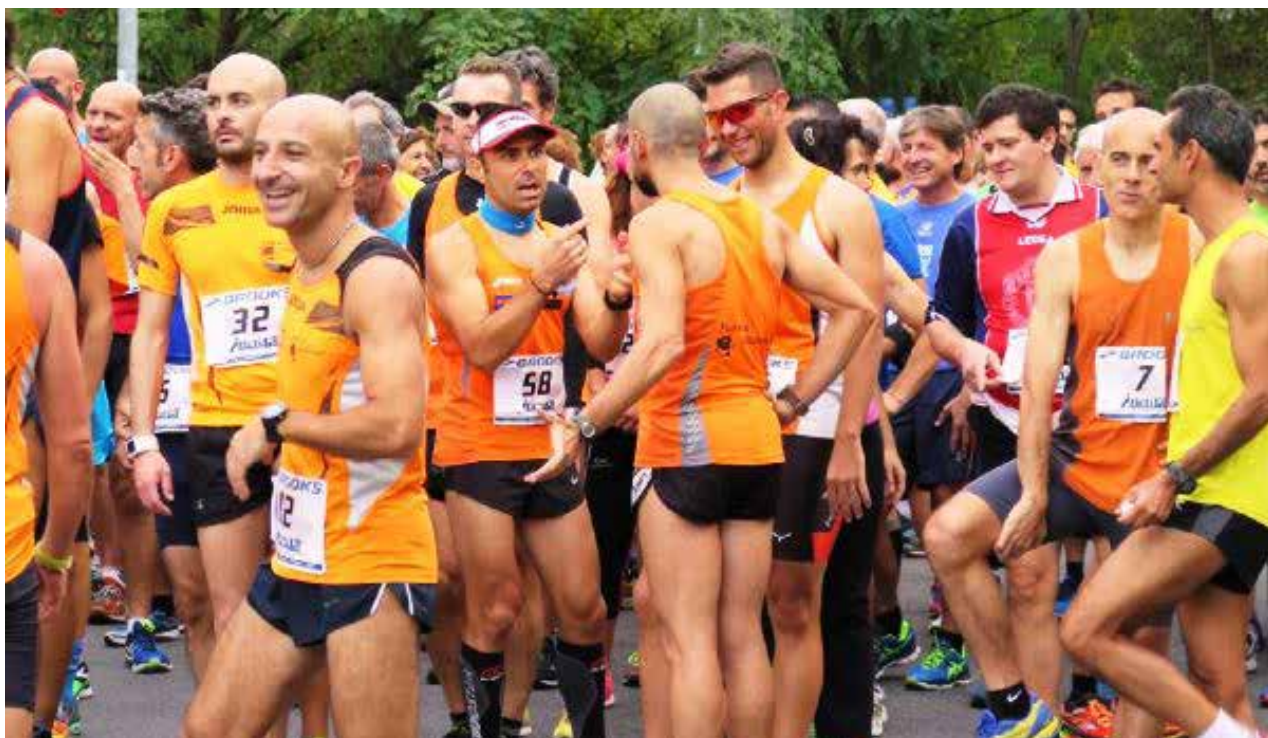
Un gruppetto di orange scherza prima della partenza della gara

Il costo dell’iscrizione alle gare giovanili è di 3 €. Saranno premiati i primi due ragazzi e le prime due ragazze di ogni categoria.