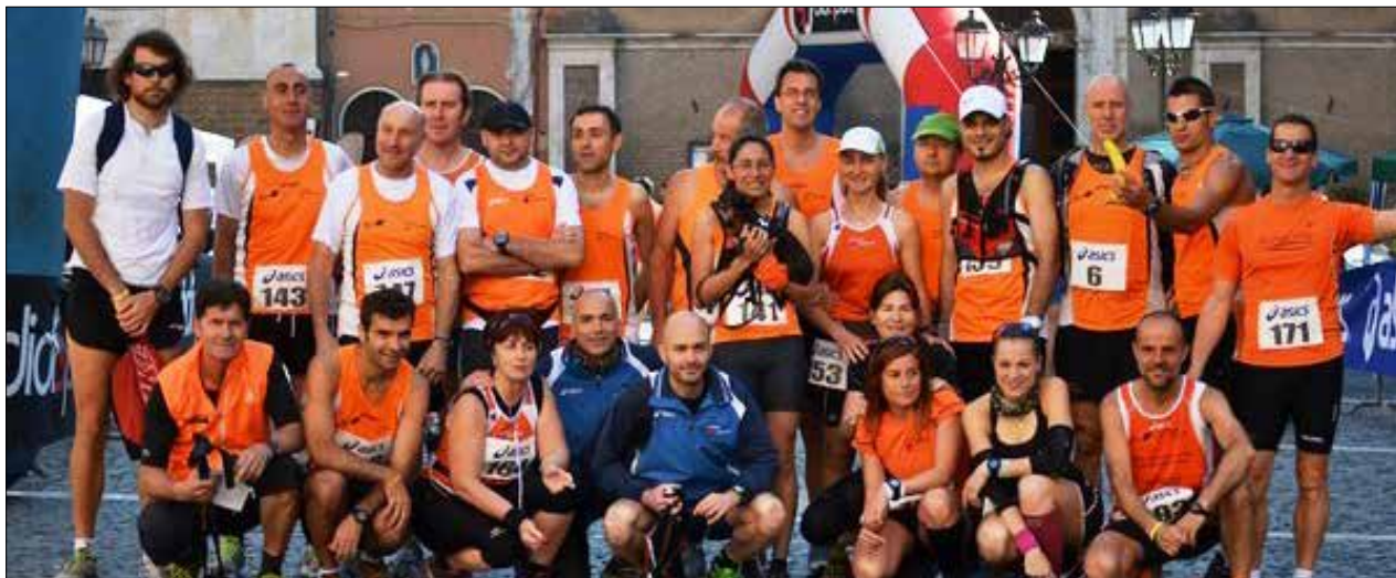
Gli orange posano al centro di Piazza Plebiscito

Domenica 19 novembre il calendario trail ci propone il "Tibur Ecotrail" , gara su sentiero di 18 km circa: qualcosa più di una gara, una manifestazione sportiva che ha il suo cuore pulsante a Tivoli e che si snoda nelle bellezze architettoniche e naturali della zona.