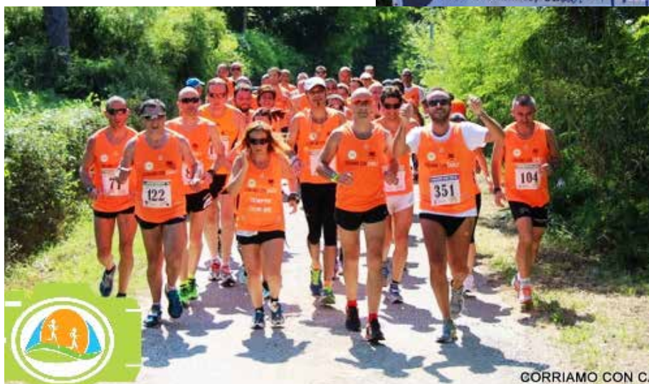
Il gruppone Orange corre compatto verso il traguardo in occasione del primo memorial Carlo Tedeschi