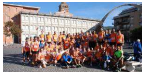
I nostri Orange a Tivoli